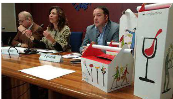
Un momento della conferenza stampa